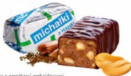
Michałki z Hanki ® Cukierek czekoladowy z orzechami archaidowymi Chocolate sweets with peanuts