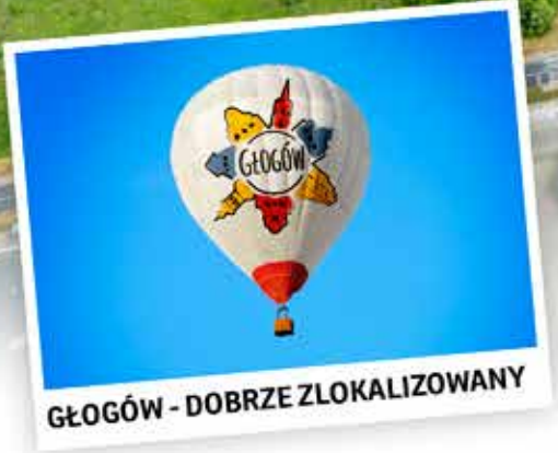
GŁOGÓW - DOBRZE ZLOKALIZOWANY