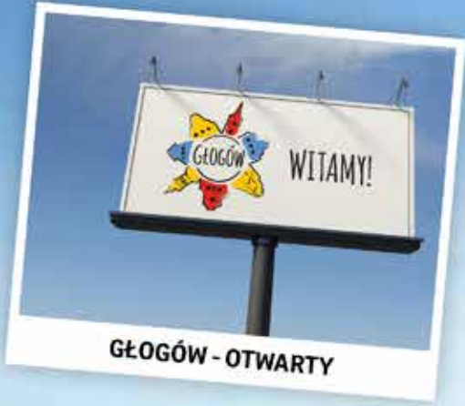
GŁOGÓW - OTWARTY