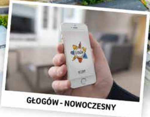
GŁOGÓW - NOWOCZESNY