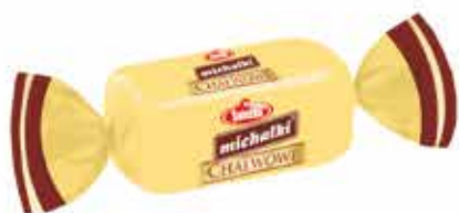
Michałki ® Chatwowe Cukierek czekoladowy z nadzieniem chatwowym Chocolate sweets with halva filling

Śnieżka-Invest Sp. z o.o. jest cenionym producentem słodyczy z Dolnego Śląska. Już od 70 lat dostarcza najwyższej jakości produkty w szerokiej gamie tradycyjnych smaków. Jedną z najbardziej uznanych propozycji są cukierki czekoladowe z orzechami arachidowymi - Michałki z Hanki. Bogatą ofertę urozmaicają również ostatnie nowości o smakach: chatwowym, rumowym i bananowym.