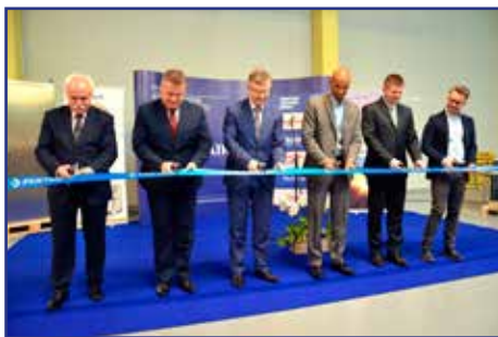
Uroczyste otwarcie drugiego zakładu Pentair Poland w Dzierżoniowie

– Wynaleziona przez nas innowacyjna technologia samoregulacji stosowana w przewodach grzejnych Raychem zmieniła na trwałe standardy obowiązujące w systemach ogrzewania elektrycznego. Wpływa ona na niezawodność użytkownika całego systemu grzewczego, jednocześnie obniżając koszty jego eksploatacji. Przewody grzejne Raychem zapewniają bezpieczeństwo użytkownika budynków w okresie zimowym i podnoszą komfort