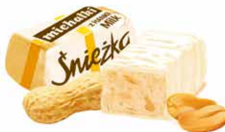
Michałki z Hanki ® Milk Cukierek z orzechami archaidowymi w białej polewie Sweets with peanuts in white coating