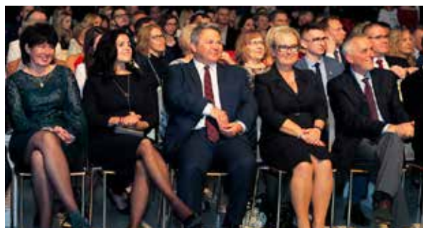
Zarząd Funduszu Regionu Wałbrzyskiego za priorytet stawia rozwój i promocję postaw przedsiębiorczych

Prestiżowa, charakterystyczna statuetka Gwiazd Biznesu, jest potwierdzeniem wyjątkowości zwycięskiej firmy w jednej z ośmiu kategorii: Mikro Biznes, Mikro Firma, Mała Firma, Średnia Firma, Podmiot Ekonomii Społecznej, Biznes Odpowiedzialny Społecznie, Instytucja, Samorząd Przyjazny Biznesowi. Przyznawana jest też nagroda dla Osobowości Dolnego Śląska.