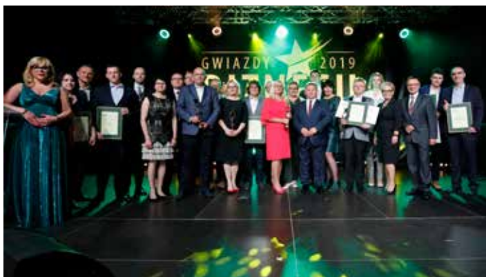
Laureaci Dolnośląskiego Plebiscytu Gospodarczego Gwiazdy Biznesu