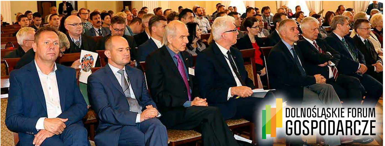
Zamek Książ w Wałbrzychu gościł blisko 200 samorządowców i biznesmenów na I. Dolnośląskim Forum Gospodarczym

Dolnośląskie Forum Gospodarcze to największa regionalna i bezpłatna konferencja gospodarcza skierowana do przedsiębiorców i samorządowców, którą raz pierwszy zorganizowano w 2017 roku w Zamku Książ w Wałbrzychu.