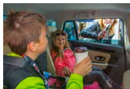
Zawody cieszą się ogromnym zainteresowaniem nie tylko mistrzów eko-jazdy, ale także rodzin z dziećmi i grup przyjaciół