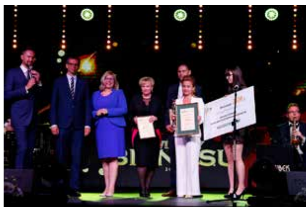
Plebiscyt gospodarczy „Gwiazdy Biznesu” ma na celu wyróżnić przede wszystkim najlepiej rozwijające się firmy i instytucje