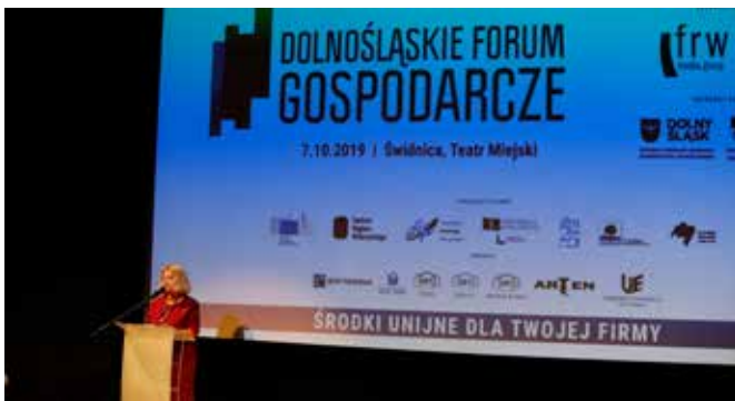
Forum Gospodarcze wspierają lokalne samorządy

Podczas każdej edycji spotykają się podmioty gospodarcze, samorządy i Instytucje Otoczenia Biznesu, aby omówić sytuację sektora mikro, małej i średniej przedsiębiorczości w regionie.