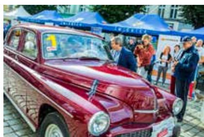
Zabytkowe samochody startują w specjalnie utworzonej Grupie Historycznej

Dolnośląski Rajd o Kropelce promuje ekologiczną jazdę, turystykę i bezpieczeństwo. Zadaniem załóg rajdowych jest pokonanie wyznaczonej trasy, w określonym czasie, przy spaleniu jak najmniejszej ilości paliwa. W punktacji równie ważne jest odwiedzenie punktów turystycznych oraz rozwiązanie zagadek. Dolnośląski Rajd o Kropelce to z założenia zawody dla kierowców amatorów, w których udział wziąć może każdy. Uczestnicy startują prywatnymi samochodami, a załogę stanowić może taka ilość osób, na jaką zarejestrowane jest auto.