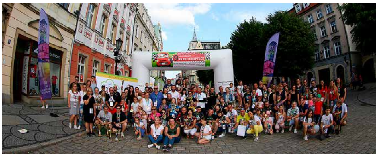
Uczestnicy 9. Dolnośląskiego Rajdu o Kropelce