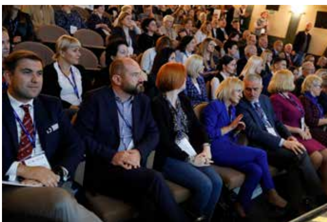
Frekwencja na Dolnośląskim Forum Gospodarczym zawsze dopisuje

Wydarzenie ma charakter otwartego spotkania. Jest szansą na pozyskanie wartościowych kontaktów ze środowiskiem biznesowym, a także okazją na dialog przedsiębiorców i władz lokalnych.