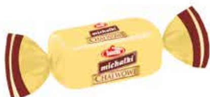
Michałki ® Chatkowe Cukierek czekoladowy z nadzieniem chatwowym Chocolate sweets with halva filling

Śnieżka-Invest Sp. z o.o. jest cenionym producentem słodyczy z Dolnego Śląska. Już od 70 lat dostarcza najwyższej jakości produkty w szerokiej gamie tradycyjnych smaków. Jedną z najbardziej uznanych propozycji są cukierki czekoladowe z orzechami arachidowymi - Michałki z Hanki. Bogatą ofertę urozmaicają również ostatnie nowości o smakach: chatwowym, rumowym i bananowym.