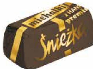
Michałki z Hanki ® Premium Cukierek czekoladowy z orzechami arachidowymi Chocolate sweets with peanuts