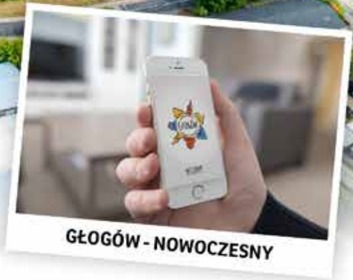
GŁOGÓW - NOWOCZESNY