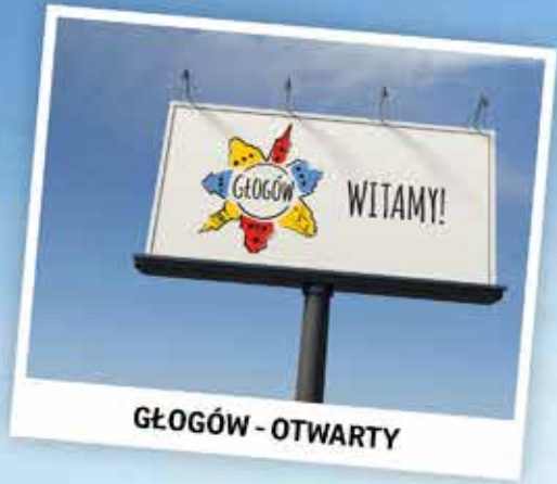
GŁOGÓW - OTWARTY