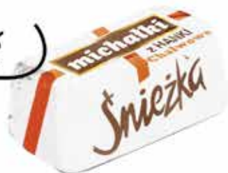
Michałki z Hanki ® Chatkowe Cukierek czekoladowy z nadzieniem chatwowym Chocolate sweets with halva filling