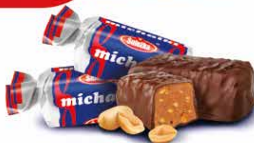
Michałki ® Cukierek czekoladowy z orzechami arachidowymi Chocolate sweets with peanuts