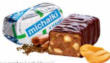
Michałki z Hanki ® Cukierek czekoladowy z orzechami arachidowymi Chocolate sweets with peanuts