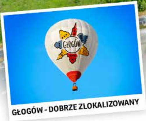
GŁOGÓW - DOBRZE ZLOKALIZOWANY