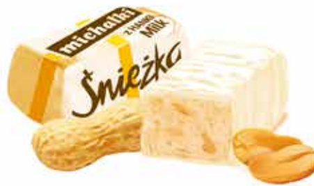
Michałki z Hanki ® Milk Cukierek z orzechami arachidowymi w białej polewie Sweets with peanuts in white coating